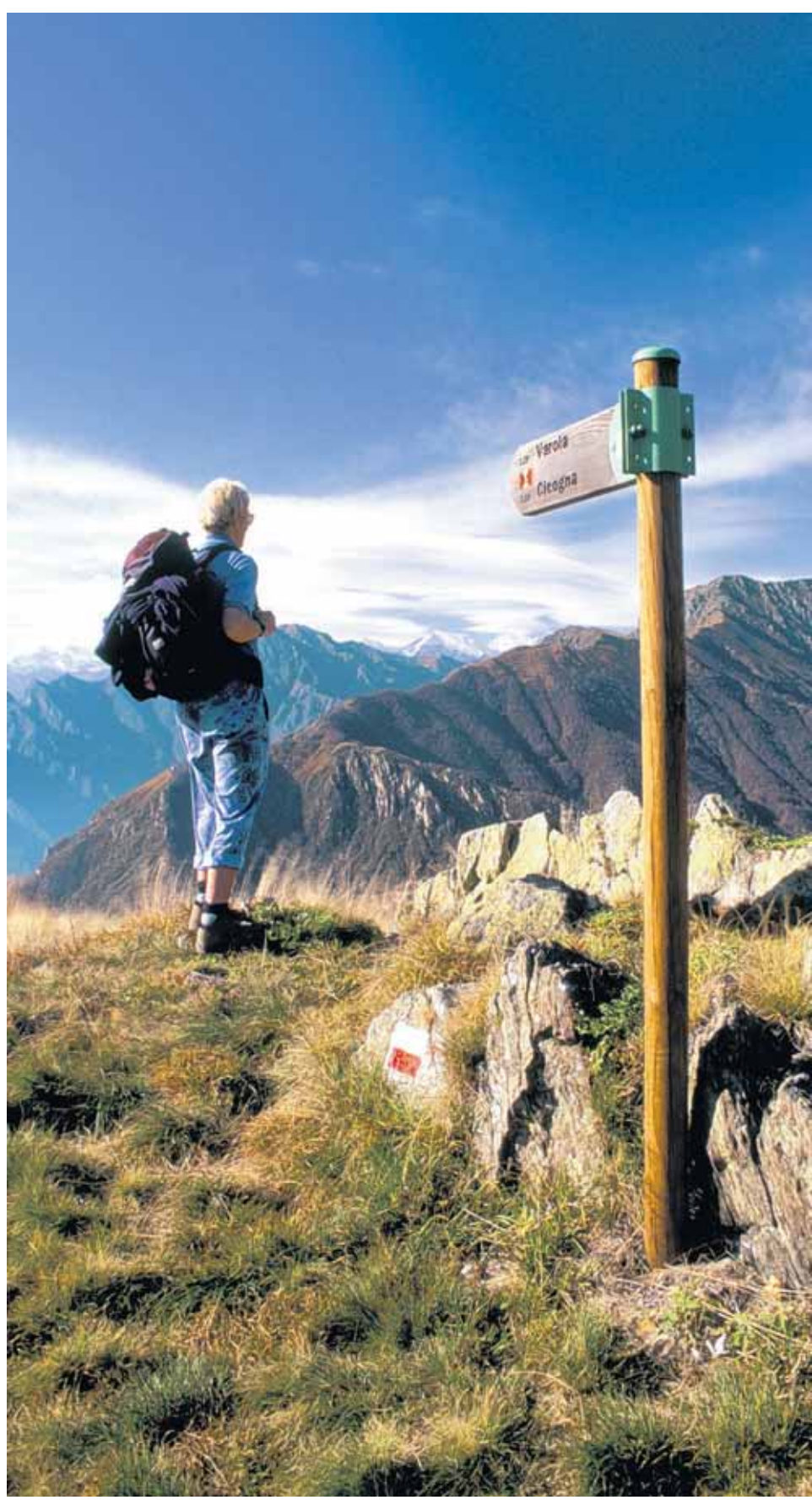
Schroffe Flanken, tief eingefräste Seitentäler und Einsamkeit erwarten den Wanderer im Val Grande.

Uns entlässt der Nationalpark gnädig, an einer beeindruckenden Pforte. Die Grenze läuft über einen felsigen Grat, in den frühere Älpler-Generationen eine breite Scharte geschlagen haben. Eine Steintreppe, die Scala di Ragozzale, leitet hinunter ins besiedelte Valle Vigezzo. Dorthin brauchen wir noch Stunden in der Einsamkeit, über Altschneefelder und lange Gegenanstiege. Aber das ist, gemessen am Val Grande, nur noch eine kleine Zugabe. Wolfgang Alber